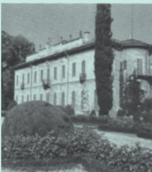
Merate - Villa "Il Subaglio"