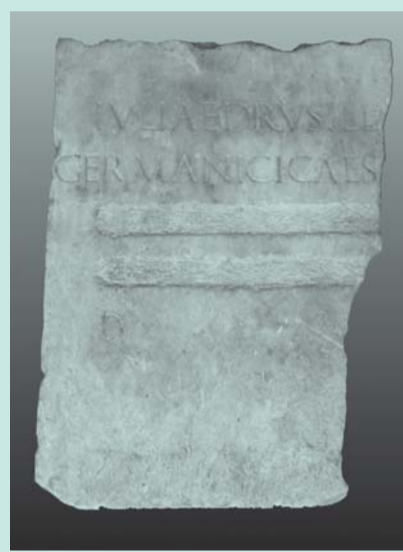
Arcore - La lapide di Drusilla