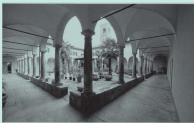
Merate - il Convento di Sabbioncello

... e per scoprire luoghi nascosti tra le colline della Brianza