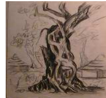
Albero d'africa (senza data)

Premiazione e consegna delle borse di studio